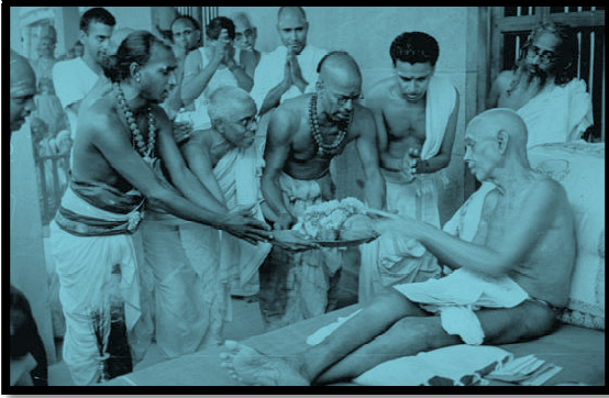
Sri Ramana Maharshi