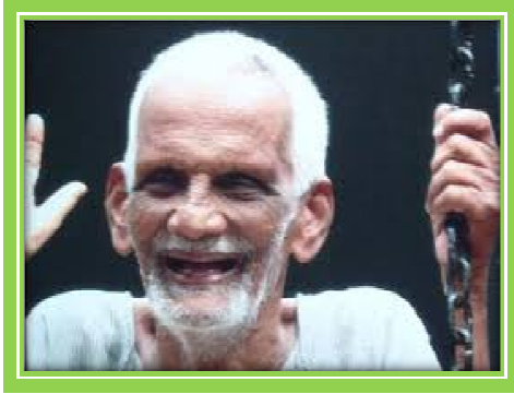
Aja, the Advaita-Jnani- Saint from Puttur (South India)